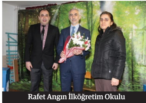
Rafet Angın İlköğretim Okulu