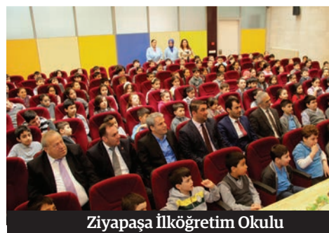
Ziyapaşa İlköğretim Okulu