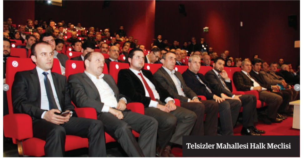
Telsizler Mahallesi Halk Meclisi