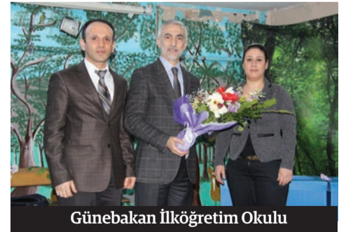
Günebakan İlköğretim Okulu