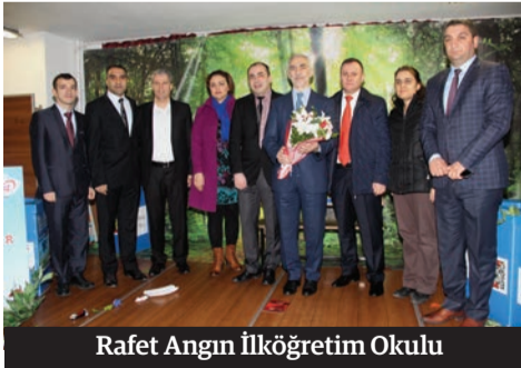
Rafet Angın İlköğretim Okulu

bir çevre ve yeşil bir gelecek için bireysel sorumlulukların yerine getirilmesi gerekiyor. Bu konuda önce ailelere sonra da çocuklara çok iş düşüyor" dedi.