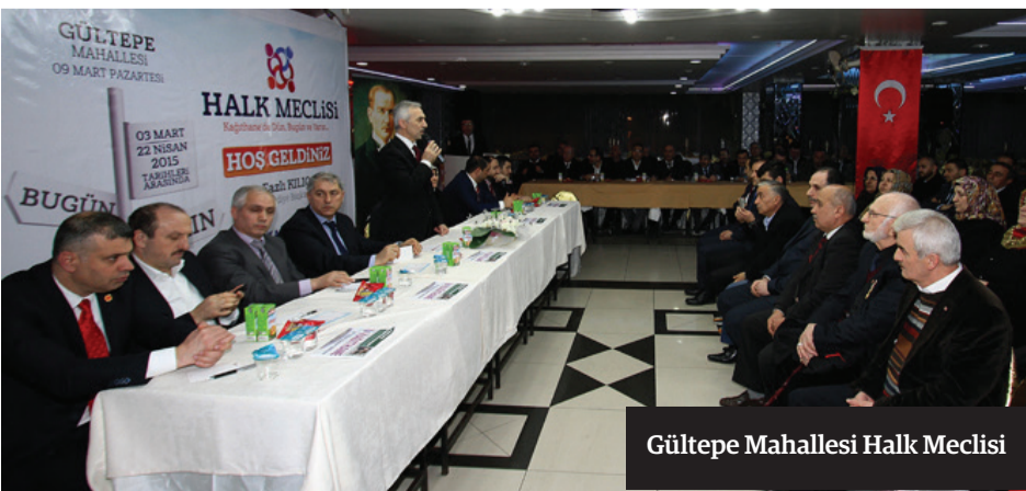
Gültepe Mahallesi Halk Meclisi

Kağıthane Belediye Başkanı Fazlı Kılıç, sabah saatlerinde başladığı ve akşam saatlerinde de Halk Meclisi toplantıları ile devam ettiği halk buluşmaları devam ediyor. Her gittiği mahallede büyük ilgi ve sevgi gösterileri ile karşılanan Başkan Fazlı Kılıç ' Mahallemizde oluşturduğumuz Gültepe Kültür Merkezi'nde Sinema, Konferans ve tiyatro salonları, Muhtarlık ve Aile Sağlığı Merkezi'nin içinde bulunduğu büyük bir konsept ile vatandaşımıza hizmet vermektedir. ' dedi.