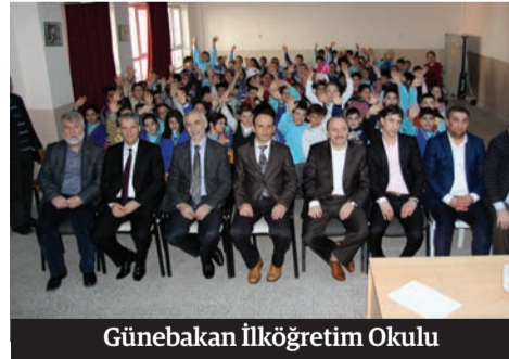
Günebakan İlköğretim Okulu