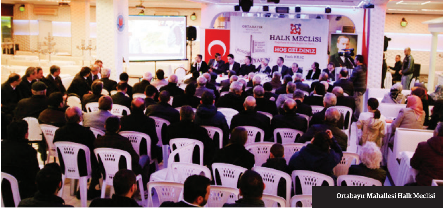
Ortabayır Mahallesi Halk Meclisi

Kağıthane Belediyesi tarafından ilçe sakinlerinin isteklerini belirlemek, proje ve yatırımlar hakkında vatandaşları bilgilendirmek üzere düzenlenen 'Halk Meclisi' toplantıları devam ediyor.