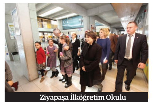
Ziyapaşa İlköğretim Okulu