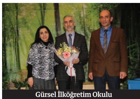
Gürsel İlköğretim Okulu