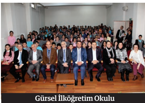
Gürsel İlköğretim Okulu