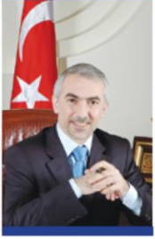
Fazlı KILIÇ Kağıthane Belediye Başkanı

Sevgili Kağıthaneliler, Mayıs ayı içerisinde de yoğun çalışmalarımıza devam ettik. Sadece ilçemizin değil, İstanbul'un en önemli mesire alanlarından olan Hasbahçe'de düzenlediğimiz Sadabad Yaz Etkinlikleri binlerce komşumuzu bir araya getirdi. Cirit, güreş, bisiklet ve uçurtma yarışmaları ile okçuluk gibi bir çok alanda düzenlediğimiz etkinlikler büyük coşku ve hoşgörüyle gerçekleşti. Cirit etkinliğimizde özellikle kadın sporcularımızın performansı vatandaşlarımızın da büyük beğenisini kazandı.