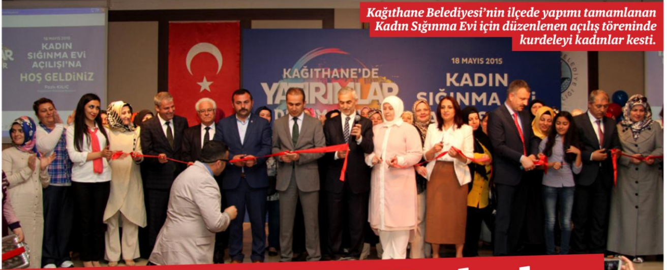
Kağıthane Belediyesi'nin ilçede yapımı tamamlanan Kadın Sığınma Evi için düzenlenen açılış töreninde kurdeleyi kadınlar kesti.