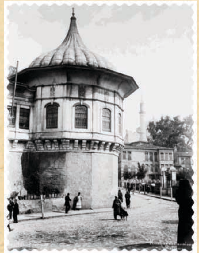
Alayköşkü, Gülhane'de bulunan İstanbul Valiliği ile İstanbul Çocuk Mahkemesi olarak bilinen binaların hemen karşısındadır.

1787'de Sultan I. Abdulhamit zamanında, Rus çarlığı II. Katerina tarafından Osmanlı topraklarına gönderilen Rus elçisi, Osmanlı Devleti'ne haddini bilmeksizin birçok teklifte bulundu ve tekliflerinde ısrarcı oldu. Elçinin bu davranışları ise Osmanlı Devleti ile Rusya'nın arasının açılmasına neden oldu. İki devlet arasındaki barışın bozulduğunu anlayan Osmanlı devlet adamları defalarca toplantılar yaptılar. Alınan karar ise Rusya'ya savaş açmaktı. Karar alındıktan hemen sonra sefer hazırlıklarına başlandı. İmparatorluğun dört bir tarafına fermanlar yollandı. Alınan karara göre Osmanlı askerlerinin "Hıdırellez"de "İsmail" isimli kalenin civarında toplanması emredildi. Sefer çıkacak olan Osmanlı Devleti, askerlerin toplanma günü olarak "Hıdırellez"i seçmişti.