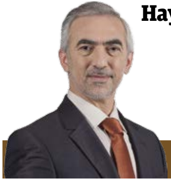
Fazlı KILIÇ Belediye Başkanı

Kıymetli Kağıthaneli komşularım sizleri sevgi ve saygıyla selamlıyorum. Geleceğe yönelik yatırımlarımız her geçen gün katlanarak devam etmekte. Bu yatırımlar arasında birinci önceliğimiz, hizmet anlayışımızın rotası olan insan odaklı hizmet yer almaktadır. En iyi hizmet ve yatırım insan için yapılandır. Orta ve uzun vadede geleceğimizi sağlam temeller üzerine inşa etmek adına gençlerimize, insanımıza verdiğimiz önem ve değer bu güne kadar olduğu gibi bu günden sonra da katlanarak devam edecektir.