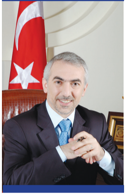
Fazlı KILIÇ Kağıthane Belediye Başkanı

Elinizde bulunan yeni sayımızda takip edeceğimiz üzere Kağıthane'miz, dolu dolu bir ayı daha geride bıraktı. Bu zaman içerisinde ilçemiz ve ilçe sakinlerimiz için hayırlı çalışmalara imza attık. İlçemizde bulunan park ve kavşaklara yerleştirdiğimiz yaklaşık 300 "Balık Gözü" kameranın bakım ve onarım işlemi bunlardan biriydi. Bütün mücadelemiz, sizlere daha güvenli, daha yaşanılabilir bir Kağıthane bırakmak için.