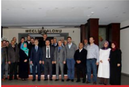
Sağlık İşleri Müdürlüğü