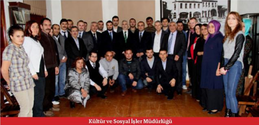
Kültür ve Sosyal İşler Müdürlüğü