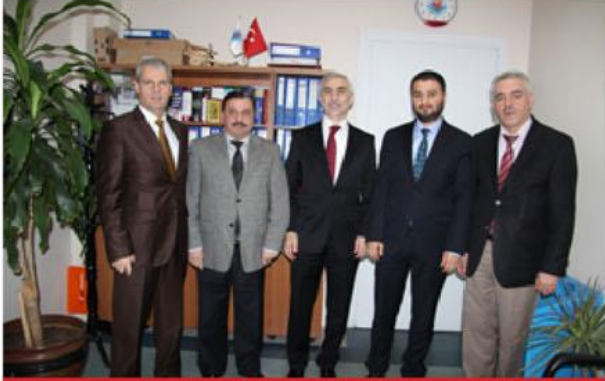
İç Denetim Birimi