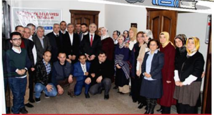
Sosyal Yardım İşleri Müdürlüğü