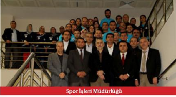
Spor İşleri Müdürlüğü