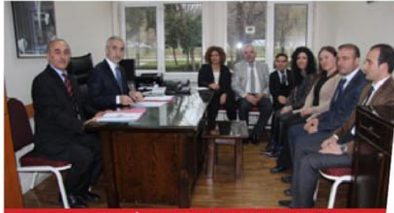
İnsan Kaynakları ve Eğitim Şefliği