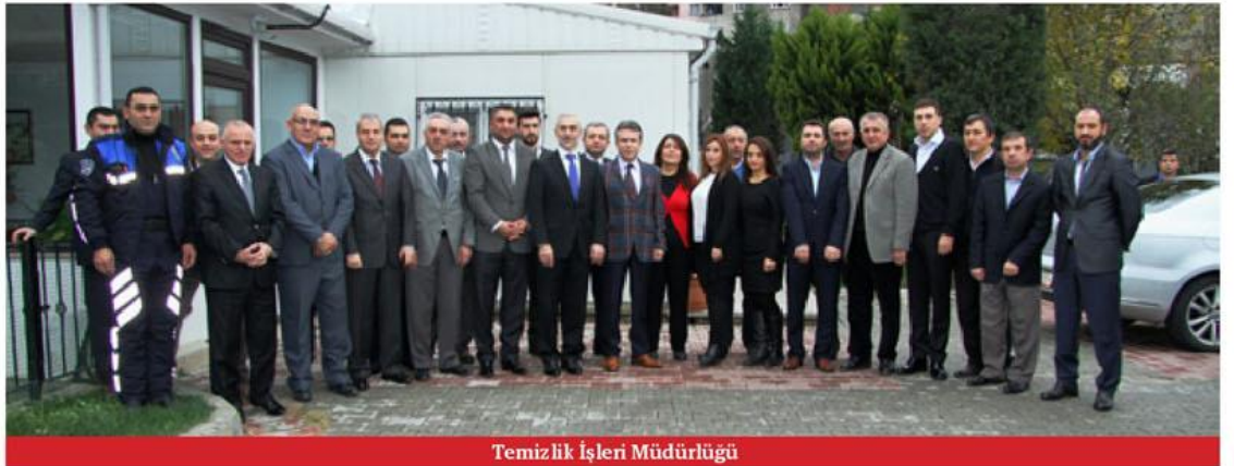
Temizlik İşleri Müdürlüğü

ne kültürel et- bir merkez ha- ğıthanelilerin uz kış ayların- :ezlerimiz ço- programlanan an merkezler nemi etkinlik- , tiyatro, kon- azede hizmet = konuştu.