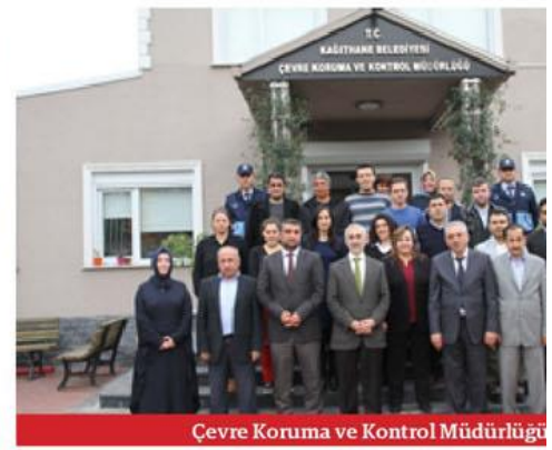
Çevre Koruma ve Kontrol Müdürlüğü